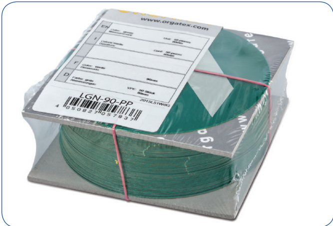
Durchmesser 90 mm